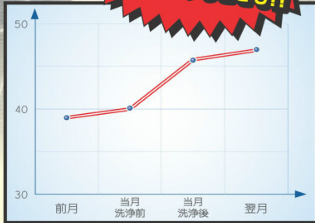
▲洗浄前後の発電効率 (発電量÷日射量にて発電効率数値を算出)