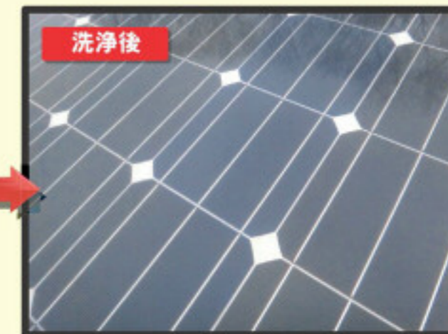
▲伸縮式特殊洗浄ガンによる洗浄前後