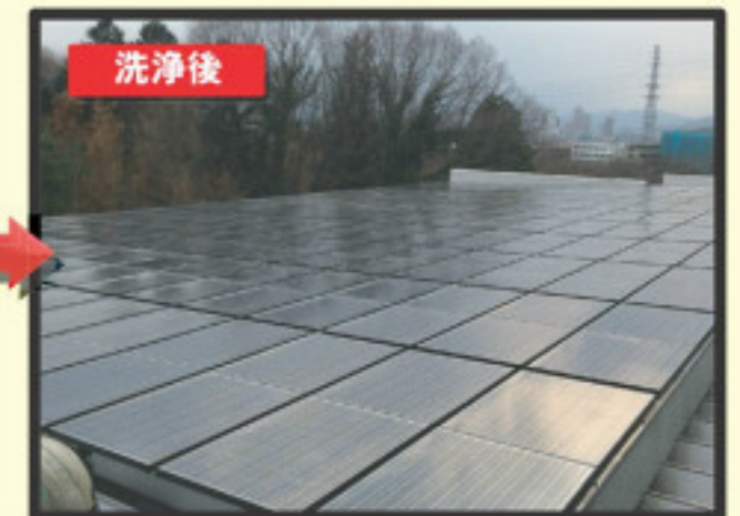
▲敷き詰められたパネルの洗浄前後